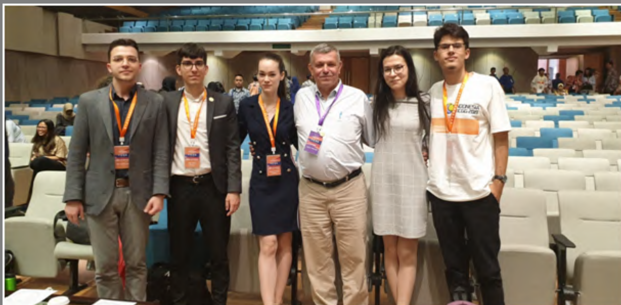
Participanții Facultății de Drept la concursul Youth Innovation Competition on Global Governance , 2020.

În perioada 15-18 iulie, două echipe din partea facultății au participat la cea de-a XIII-a ediție a competiției internaționale Youth Innovation Competition on Global Governance , desfășurată în Indonezia. Au fost obținute locul I la Most Innovative Team pentru proiectul MinPlas social enterprise - a framework for a sustainable solution against plastic pollution , și locul al II-lea la Etapa Ingnite Talk . Este al șaptelea an consecutiv în care o echipă de la Facultatea de Drept a UBB a fost selectată să participe la YICGG. Premiera absolută o reprezintă faptul că au participat două echipe de la aceeași facultate și universitate. În primăvara anului 2019, Universitatea Babeș-Bolyai a fost invitată să facă parte din rețeaua YICGG Core Working Network.