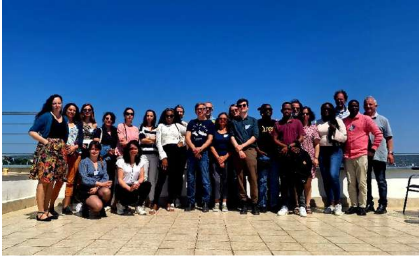
Participanți ai International Project Management Staff Training Week