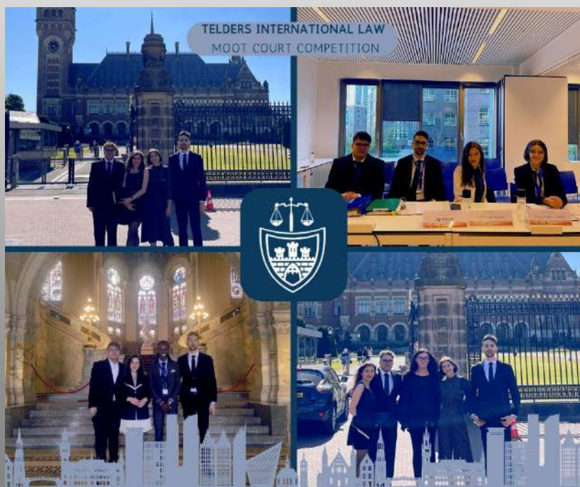
Concursul de procese simulate „Telders”