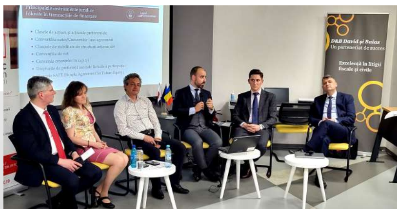
Conferința Națională de Drept Comercial